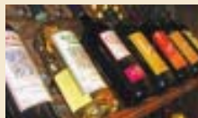
Vino: Exportamos algo más y destilaremos 6,9 mill. de Hl. ...Pág. 14

El ovino con dificultades en Castilla y León. Habrá movilizaciones pero la situación es de dificultad en toda España y en algunos países de Europa .... pág.30