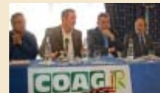
Laboral: COAG-IR presenta una guía de contratación de inmigrantes .. Pág. 29